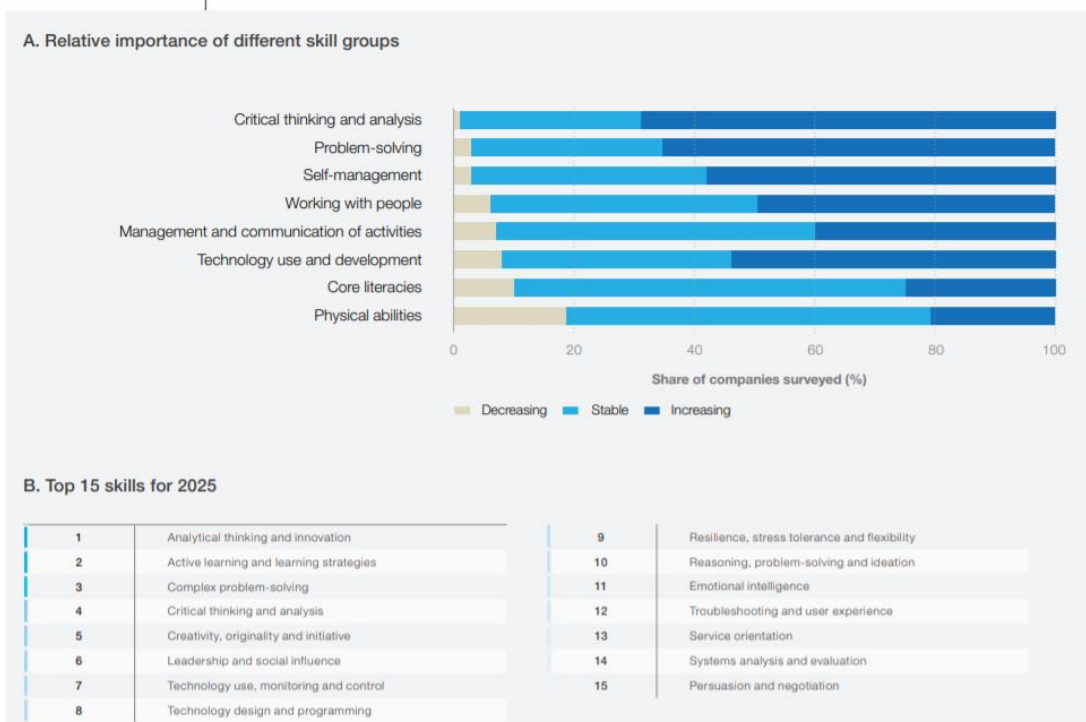
ภาพที่ 4 Perceived skills and skills groups with growing demand by 2025, by share of companies surveyed