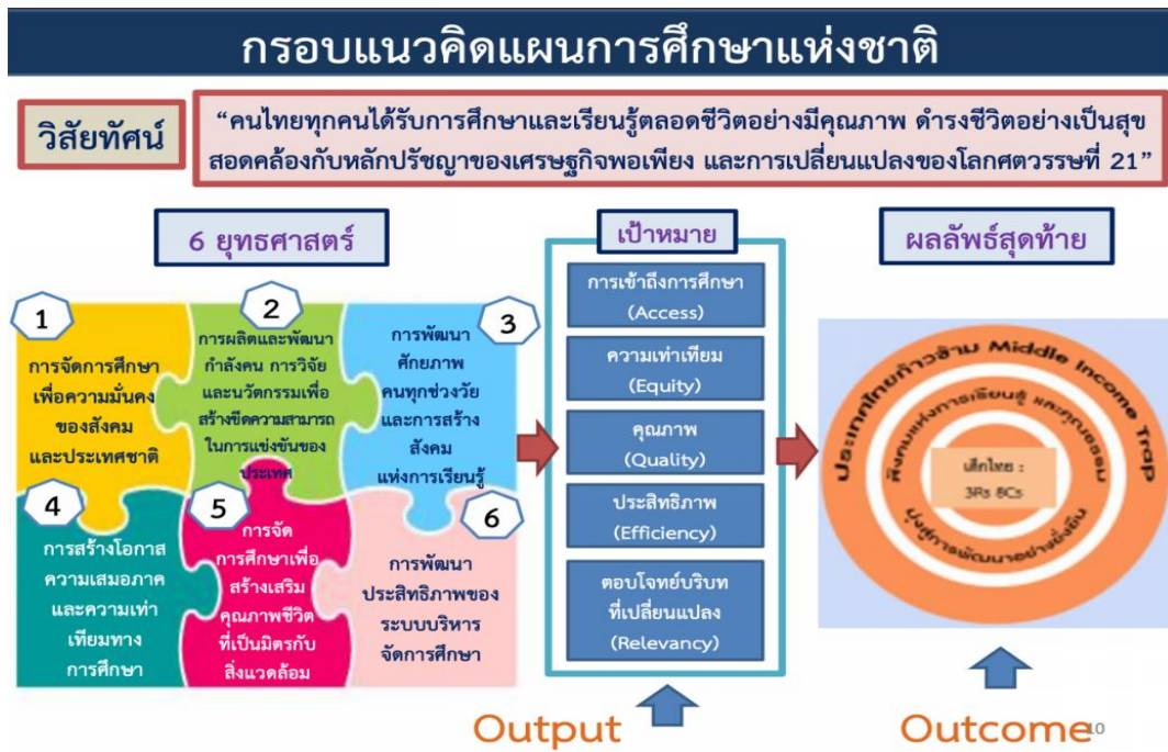
ภาพที่ 3 กรอบแนวคิดแผนการศึกษาแห่งชาติ