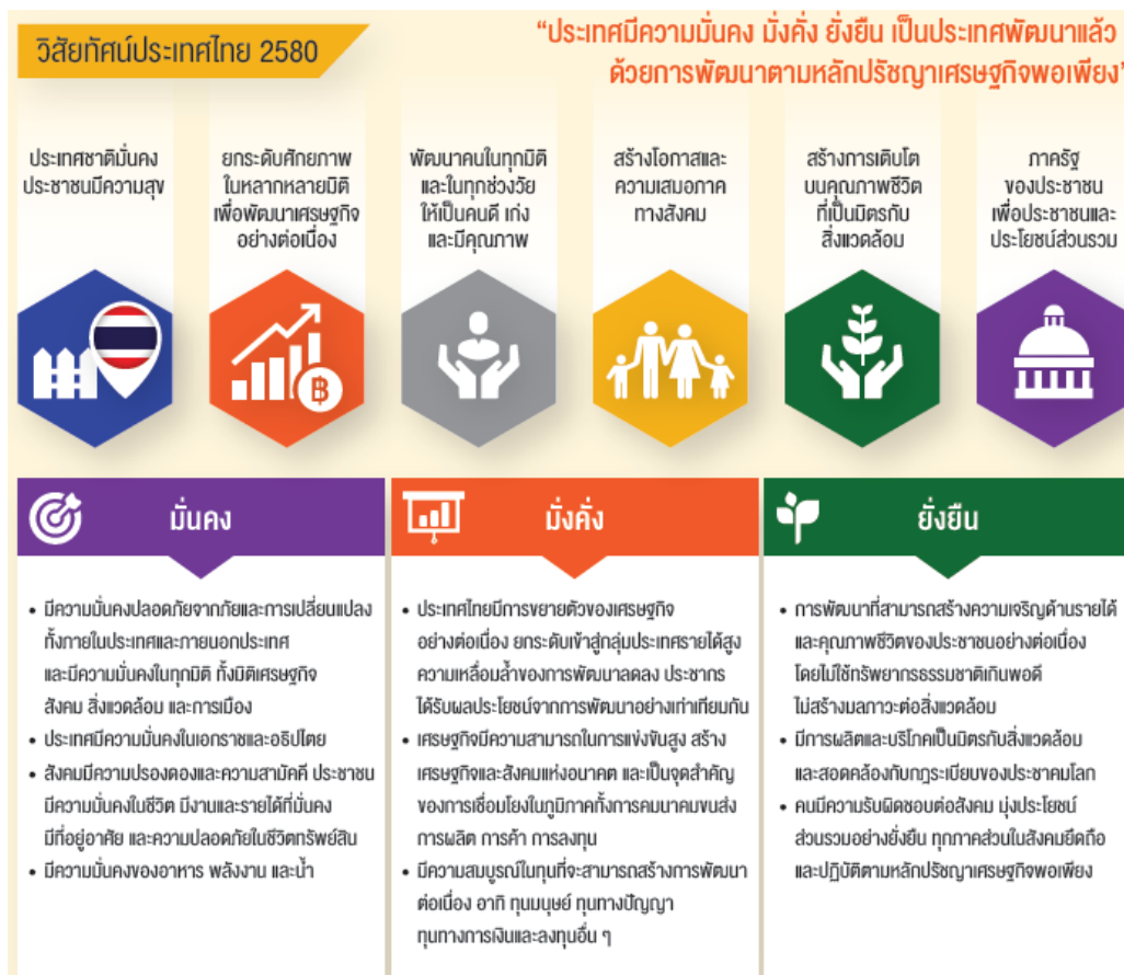
ภาพที่ 1 วิสัยทัศน์ประเทศไทย 2580

ยุทธศาสตร์ที่ 6 ด้านการปรับสมดุลและพัฒนาการบริหารจัดการภาครัฐ (1) ภาครัฐมีวัฒนธรรมการทำงานที่มุ่งผลสัมฤทธิ์และผลประโยชน์ส่วนรวม ตอบสนองความต้องการของประชาชนได้อย่างสะดวก รวดเร็ว โปร่งใส (2) ภาครัฐมีขนาดที่เล็กลง พร้อมปรับตัวให้ทันต่อการเปลี่ยนแปลง (3) ภาครัฐมีความโปร่งใส ปลอดภัย ยุติธรรม และประพฤติมิชอบ และ (4) กระบวนการยุติธรรม เป็นไปเพื่อประโยชน์ต่อส่วนรวมของ ประเทศ