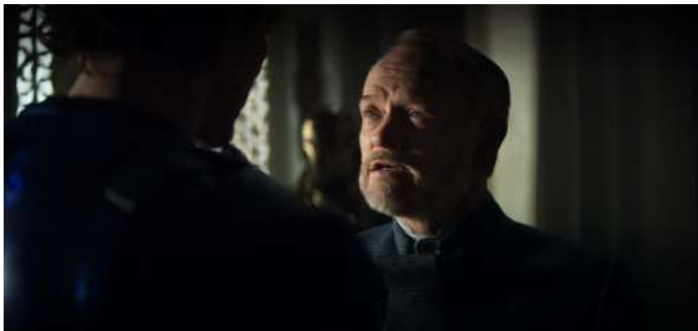
นักคณิตศาสตร์ประวัติศาสตร์ ‘ฮารี เซลดอน’

ต้องยอมรับว่าเนื้อหาของ Foundation ไม่ใช่จะดัดแปลงเป็นเวอร์ชันคนแสดงได้ง่ายๆ เหตุผลหลัก คือ อาซิโมฟ เล่าเนื้อเรื่องในสเกลใหญ่มาก แค่อาณาจักรของจักรวรรดิในเรื่องก็กินอาณาเขตกว้างใหญ่ระดับกาแล็กซี เหตุการณ์ส่วนใหญ่เกิดขึ้นต่างเวลาต่างดวงดาวกัน และตัวละครในเรื่องเองก็มีอยู่ไม่ใช่น้อยๆ การมาถึงของทีวีซีรีส์ Foundation จึงเป็นเหมือนปรากฏการณ์สำคัญที่บรรดาคนคลั่งไคล้ไซไฟกาปฏิบัติทรอคอย Foundation เล่าถึง ‘ฮารี เซลดอน’ นักคณิตศาสตร์ประวัติศาสตร์ (Psychohistory)—ศาสตร์ที่รวมเอา คณิตศาสตร์ จิตวิทยา และประวัติศาสตร์เข้าด้วยกันเพื่อพยากรณ์พฤติกรรมของคนจำนวนมาก—ถ้าเทียบกับตอนนี้ก็อาจจะคล้ายๆ อาซิฟ data scientist แต่วิเคราะห์ big data ระดับกาแล็กซี เซลดอนคำนวณข้อมูล มหาศาลด้วยสมการอันซับซ้อนจนพบว่า จักรวรรดิที่อยู่มานานกว่าหมื่นปีกำลังจะพังทลายลง และทางรอดทางเดียวคือการสร้าง Foundation (สถาบันสถาปนา) โครงการที่เซลดอนคิดขึ้นมาเพื่อเป็นแผนรองรับสำหรับมนุษยชาติ