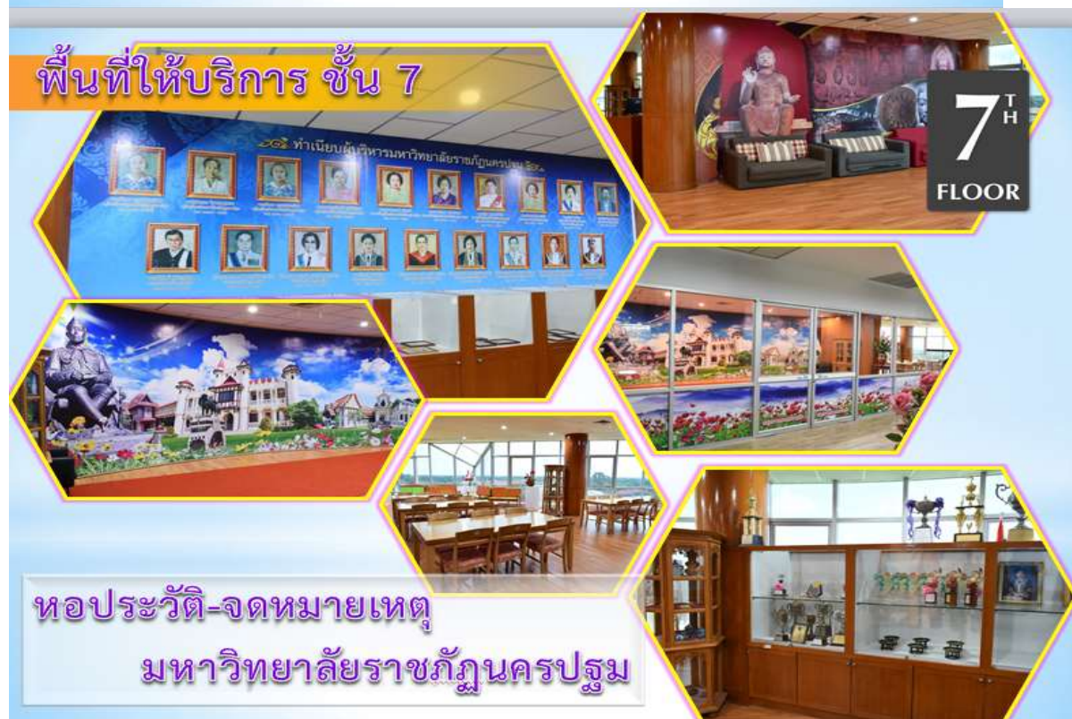
ชั้น 7 อาคารบรรณราชนครินทร์