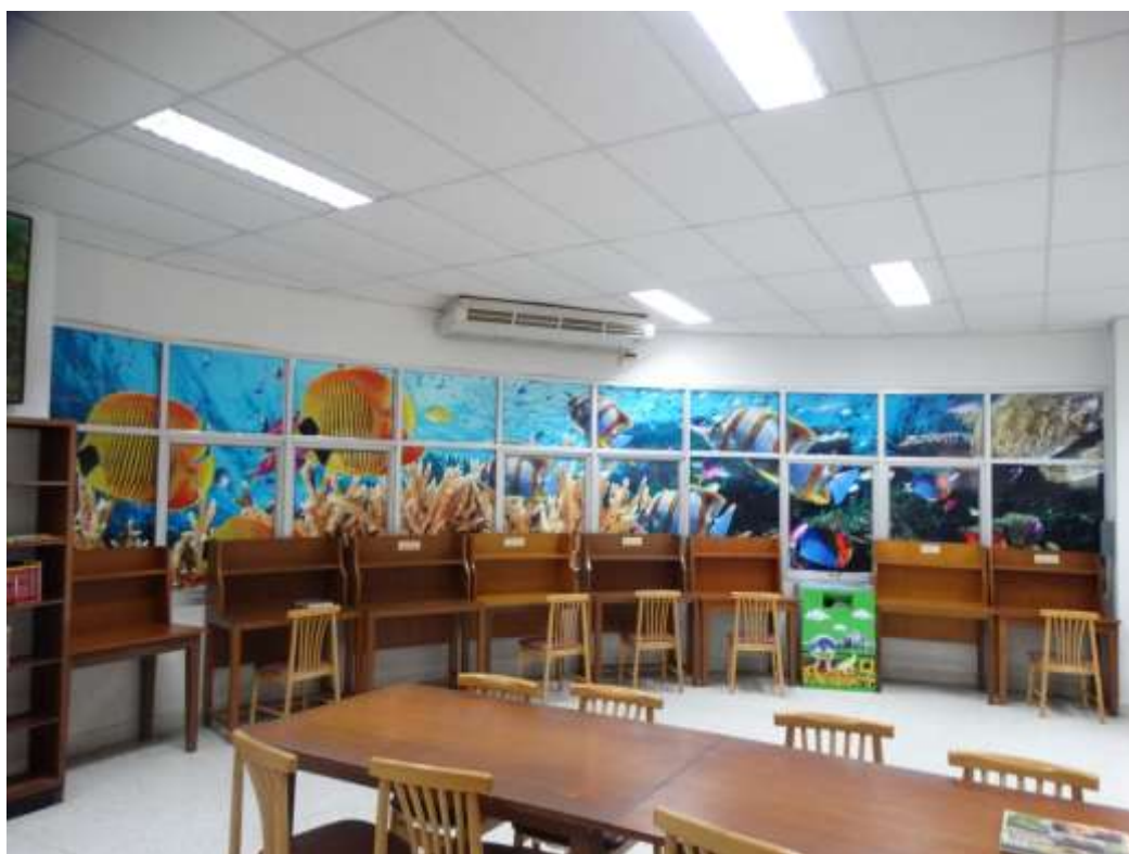
ชั้น 3 อาคารห้องสมุด 5 ชั้น