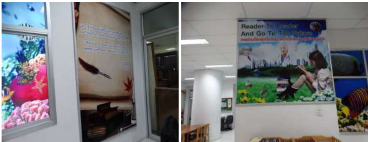
ชั้น 4 อาคารบรรณราชนครินทร์ และชั้น 4 อาคารห้องสมุด 5 ชั้น