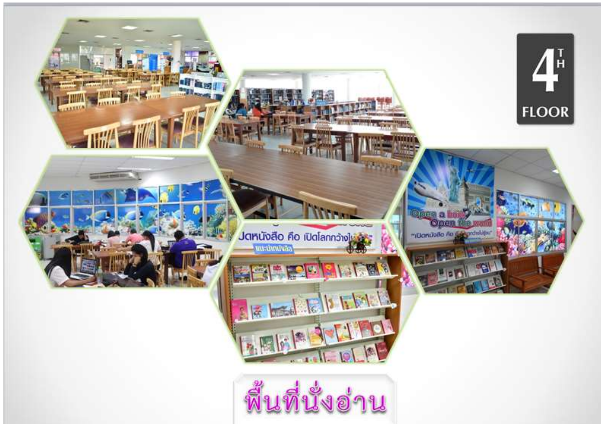
ชั้น 4 อาคารบรรณราชนครินทร์ และชั้น 4 อาคารห้องสมุด 7 ชั้น