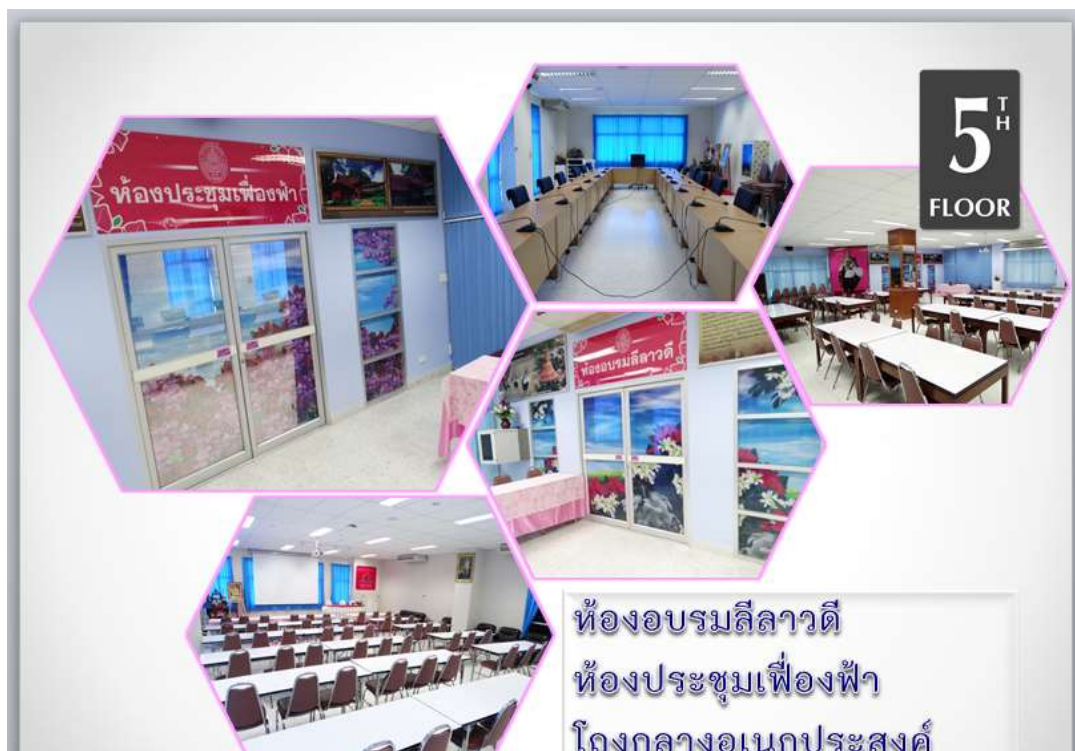
ห้องโถงกลาง ชั้น 5 อาคารห้องสมุด 5 ชั้น