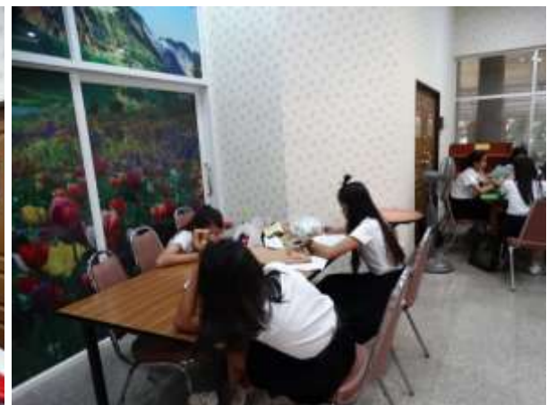
บรรยากาศการเรียนรู้ของห้อง Relax Time สำนักวิทยบริการฯ อาคารห้องสมุด 5 ชั้น