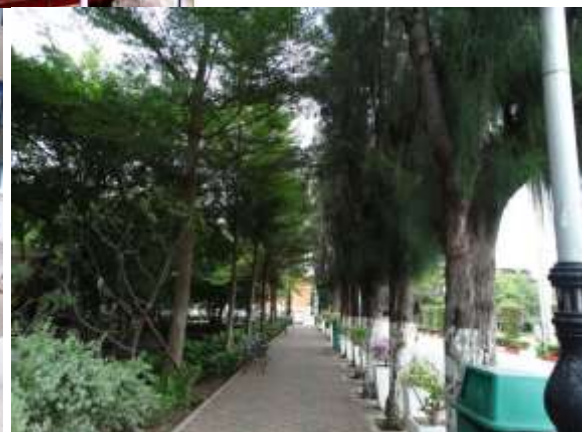
บรรยากาศด้านหลังและบริเวณโดยรอบสำนักวิทยบริการฯ อาคารบรรณราชนครินทร์