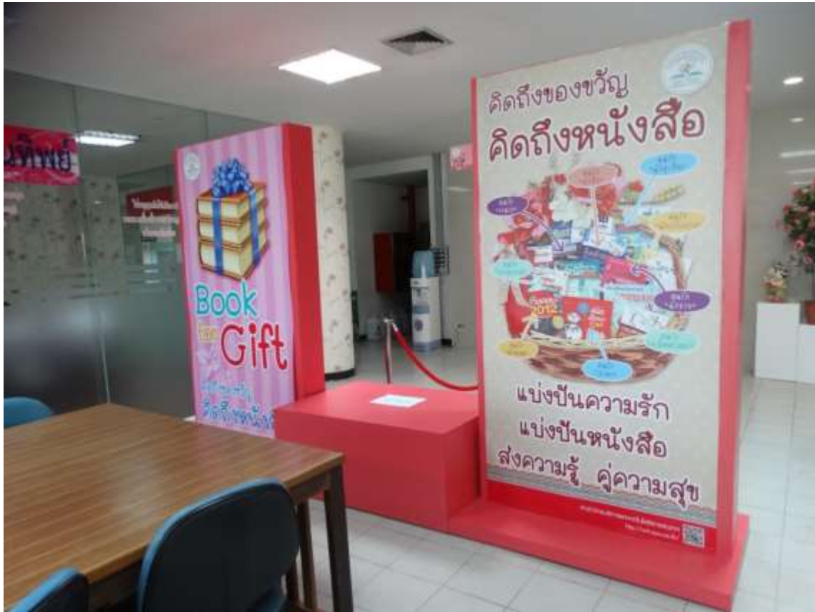
ชั้น 5 อาคารบรรณราชนครินทร์