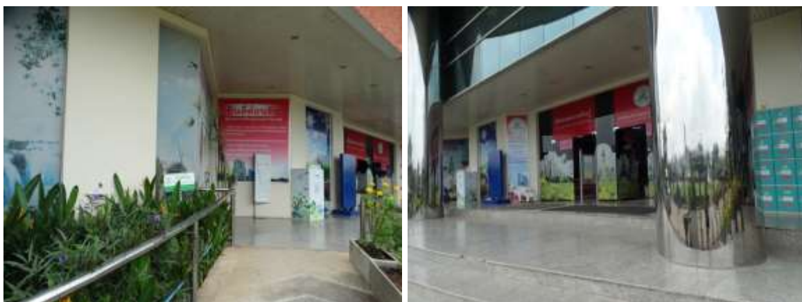
บรรยากาศด้านหน้าสำนักวิทยบริการ อาคารบรรณราชนครินทร์