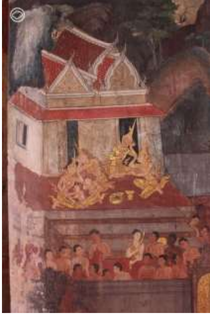
วัดสุวรรณาราม กรุงเทพมหานคร

และกัณฑ์สุดท้ายก็คือนครกัณฑ์ เป็นกัณฑ์ที่พูดถึงการเสด็จกลับเมืองเซตุครของพระเวสสันดรและคณะ ซึ่งเมื่อกลับไปถึง พระเวสสันดรก็ได้ขึ้นครองราชสมบัติ ปกครองเมืองด้วยความเมตตาและทานบริจาคจนสิ้นอายุขัย ฉากหลักที่ช่างมักจะเขียน ก็คือฉากขบวนเสด็จของพระเวสสันดรกลับเมือง บางวัดเขียนทั้งขบวนขาไปและขบวนขากลับ ซึ่งวิธีสังเกตว่าขบวนไหนเป็นขบวนไหน ให้ดูที่ต้นทางกับปลายทางครับ ดูว่าฝั่งไหนเป็นเมือง ฝั่งไหนเป็นศาลา ซึ่งแน่นอนว่า ฝั่งที่ออกจากเมืองก็คือฉากขบวนขามาของกัณฑ์ฉกษัตริย์ ส่วนฝั่งที่ออกมาจากศาลาเป็นขบวนขากลับเมืองเซตุครของนครกัณฑ์ แต่ถ้าวัดไหนเขียนขบวนขาเดียวก็มักจะเป็นขบวนขากลับนะครับ