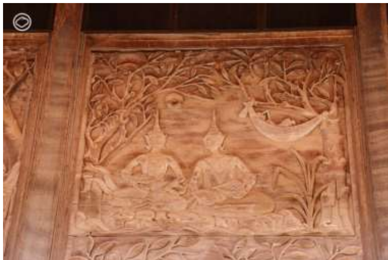
วัดกุฎี จังหวัดเพชรบุรี

มาถึงกัณฑ์รองสุดท้ายอย่างกัณฑ์ฉกษัตริย์ซึ่งเป็นกัณฑ์ที่ 12 กันแล้วครับ ซึ่งกัณฑ์นี้เป็นเรื่องราวการรับพระเวสสันดรกลับเมืองครับ โดยเล่าถึงขบวนเสด็จของพระเจ้าสุทนต์ นางมุตติ พระกัณหา และพระชาลี ที่เดินทางไปถึงอาศรมของพระเวสสันดรและนางมัทรี พอทั้ง 6 คนได้พบหน้ากันอย่างพร้อมหน้าพร้อมตาก็มารู้สึกปลื้มปิติอย่างมากจนถึงแก่วิสัญญาหรือสลบกันหมด พอข่าวราชบริพารมาพบเข้าก็ดีใจจนสลบไปเช่นกัน จนพระอินทร์ต้องบันดาลฝนโบกขรพรรษซึ่งเป็นฝนพิเศษจนทั้งหมดฟื้นขึ้นมา แล้วจึงทูลเชิญพระเวสสันดรและนางมัทรีกลับเมืองเชตุตร ซึ่งซีนี่ช่างนิรมลเขียนหลักๆอยู่ฉากเดียว นั่นก็คือ ฉากที่ทั้งหมดพบกันอีกครั้งในที่พักของพระเวสสันดรและร้องไห้ดีใจจนสลบไป ซึ่งมีทั้งการสลบแบบนาฏลักษณะและสลบจริงๆ อยู่ที่ว่าช่างที่เขียนฉากนี้เป็นช่างพื้นบ้านหรือช่างหลวง