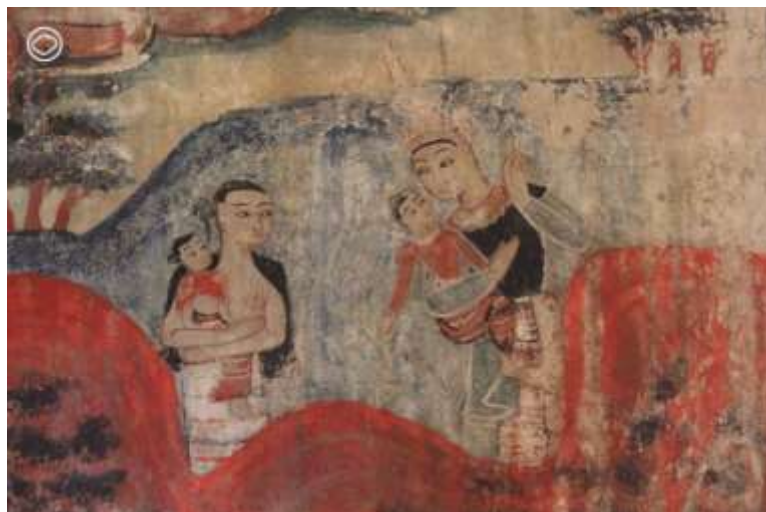
วัดบวกรกรหลวง จังหวัดเชียงใหม่

เมืองมา แถมยังเป็นเชื้อสายกษัตริย์แห่งเมืองสีพี จะให้ไปครองเมืองอื่นคงไม่ได้ กษัตริย์เมืองเจตราชูร์จึงให้พราวนเจตบุตรทำหน้าที่เป็นคนเฝ้าทางเข้าป่าแทน โดยเมื่อทั้ง 4 พระองค์เดินทางไปถึงป่าแล้ว พระอินทร์ได้ให้เทวดามาเนรมิตศาลาไว้รองรับ ซึ่งถ้าดูจากเนื้อหาที่เล่าให้ฟัง ฉากที่จะต้องปรากฏในจิตรกรรมฝาผนังน่าจะต้องเป็นฉากที่กษัตริย์เมืองเจตราชูร์มาเข้าเฝ้าพระเวสสันดร หรือฉากที่พระเวสสันดรและคณะเดินทางไปถึงศาลาในป่าวงกต ซึ่งก็มีจริงๆ แต่ในจิตรกรรมสมัยหลังนิยมเขียนฉาก 4 กษัตริย์เดินทางแทนกันก็น่ามากกว่า ดังนั้นถ้าใครไปตามวัดเจจฉากนี้แล้วเขียนว่า ‘กัณฑ์วนประเวศน์’ ก็อย่าแปลกใจนะครับ