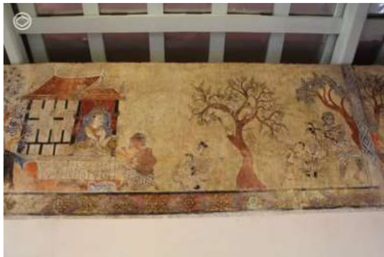
วัดคูเต่า จังหวัดสงขลา

เข้าสู่ครึ่งหลังของเนื้อเรื่องกับกัณฑ์ที่ 8 นามว่ากัณฑ์กุมาร ดูจากชื่อก็รู้เลยว่า ตัวเอกของกัณฑ์นี้ก็คือ พระกัณหาและพระชาลีแน่นอน โดยกัณฑ์นี้เริ่มด้วยการที่ชุกเซอร์เวย์ที่พักของพระเวสสันดรก่อน แล้วก็เฝ้ารอจน นางมัทรีออกไปหาผลไม้ในป่าจึงเดินเข้าไปขอสงกุมารกับพระเวสสันดร เพราะถ้าแม่อยู่ แม่ไม่มีทางยกลูกให้คนอื่นง่ายๆ แน่ๆ เรียกว่าชุกแผนสูงใช้ได้ พอได้จึงหว่านแหเข้าป่าขอสงกุมาร ซึ่งก็แน่นอนว่าพระเวสสันดรยกให้ พอรู้ว่าจะต้องไปอยู่กับชุก ทั้งพระกัณหาและพระชาลีต่างก็หนีไปหลบอยู่ในสระบัว จนพระเวสสันดรต้องตามไปเกลี้ยกล่อม พรรณนาคุณของทานบารมีจนสงกุมารใจอ่อน โดยพระชาลีขึ้นมาก่อน พระกัณหาจึงค่อยตามมา จากนั้นพระเวสสันดรจึงประทานสงกุมารแก่ชุก ชุกจึงข่มโดยการทุบตีทั้งสองจนหนีกลับมาหาพระเวสสันดร จนผู้เป็นพ่อต้องเกลี้ยกล่อมรอบที่สองให้สงกุมารให้ยอมตามชุกไป ซึ่งฉากนี้ช่างนิยมนวาดขึ้นที่พระเวสสันดร เกลี้ยกล่อมสงกุมารให้ขึ้นจากสระบัว โดยเลือกตอนที่พระชาลีขึ้นมาราบพระบาทบิดา แต่ก็มีบ้างที่ช่างวาดฉาก ยกสงกุมารให้ชุก หรือฉากที่ชุกเอาเชือกผูกข้อมือสงกุมารแล้วลากไปก็มีบ้างเหมือนกันครับ