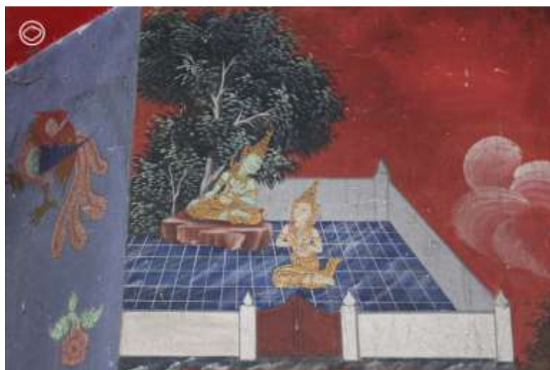
วัดวิเศษชัยชาญ จังหวัดอ่างทอง

กัณฑ์ศรणीเป็นกัณฑ์แรกและเป็นปฐมเหตุของเรื่องนี้ เป็นกัณฑ์ที่ว่าด้วยการที่พระอินทร์ประทานพร 10 ประการให้กับนางผุสดี ก่อนจะลงไปจุติเป็นมารดาของพระเวสสันดรชาดก ซึ่งพรแต่ละข้อผม เชื่อว่าเป็นพรที่สาว ๆ ทุกคนอยากจะได้แน่ ๆ ไม่ว่าจะขอให้หน้าอกไม่หย่อนยาน ขอให้ผิวงาม หรือขอให้ท้องยังแบนราบแม้จะตั้งครรภ์อยู่ แต่พรข้อสำคัญที่นางผุสดีขอกับพระอินทร์ก็คือ “ขอให้มิโอรสเป็นผู้รักในการบริจาคทานยิ่งกว่าชีวิต” โดยกัณฑ์นี้ช่างมักจะเขียนเป็นภาพพระอินทร์ เทพเจ้าแห่งสายฟ้าผู้มีกายสีเขียวกำลังให้พรแก่นางผุสดี โดยมีแบกกราวด์หลากหลายแล้วแต่ยุคสมัย