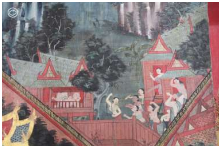
วัดใหญ่อินทาราม จังหวัดชลบุรี

กัณฑ์ที่ 6 อย่างกัณฑ์จุลพน เป็นกัณฑ์ที่ว่าด้วยการเดินทางครั้งแรกของชูชกเพื่อไปหาพระเวสสันดร ซึ่งถ้าคุณคิดว่าชูชกเป็นยอดนักเดินทาง คุณคิดผิดครับ ชูชกไม่ได้รู้ทางขนาดนั้น แต่ชูชกมีตัวช่วยที่มาโดยไม่ทันตั้งใจ นั่นก็คือพรานเจตบุตรนั่นเอง แถมตัวช่วยยังมาพร้อมบรรยากาศไม่เป็นมิตรด้วย เพราะเจอกันปุ๊บ ชูชกโดนหมาของพรานเจตบุตรไล่จนต้องขึ้นไปหลบบนต้นไม้ แถมเกือบจะโดนยิงดับต้นสิ้นชีวิตี เดชะบุญ สกิลนักพูดระดับเทพของชูชกทำงาน หลอกพรานบุญว่าตัวเองเป็นคนของพระเจ้าสี่ยุ้ย จะมาพาพระเวสสันดรกลับเมือง พรานเจตบุตรก็หลงเชื่อ จึงชวนกันไปกินข้าวที่บ้านแถมยังบอกทางไปให้ชูชกอีกต่างหาก ดังนั้น เมื่อจะเขียนจิตรกรรมตอนนี้ ก็ต้องเขียนฉากที่ชูชกโดนหมาไล่ขึ้นต้นไม้แน่นอนครับ