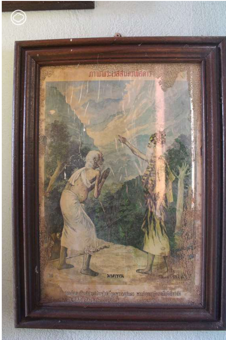
ภาพในกรอบฝีมืออาจารย์เหม เวชกร

จากกัณฑ์จุลพน ก็ต้องต่อด้วยกัณฑ์ที่ 7 อย่างกัณฑ์มหาพนครับ นี่ถือเป็นภาคต่อของกัณฑ์จุลพน เพราะเป็นกัณฑ์ที่สกลีนักพูดของชูชกทำงานอีกครั้งเพื่อหลอกคนให้หลงเชื่อ โดยเหยื่อในครั้งนี้คืออัจจุตฤณีครับ แต่รอบนี้ชูชกไม่ได้โดนไล่ขึ้นต้นไม้แล้วนะครับ ทว่าสิ่งที่เหมือนกันก็คือ ฤณีโดนชูชกหลอกถามทางครับ รอบแรก หลอกว่าเป็นคนของพระเจ้าสุยชัย รอบนี้หลอกว่าอยากสนทนารธรรมกับพระเวสสันดร และฤณีก็โดนหลอกเข้าอย่างจัง บอกทางชูชกจนในที่สุด ชูชกก็หาทางไปหาพระเวสสันดรจนได้ และฉากนี้ก็มักจะแสดงด้วยภาพอัจจุตฤณีกำลังชี้บอกทางให้กับชูชก โดยฉากหลังอาจจะเป็นป่า ริมน้ำ หรือในศาลาก็ได้ครับ