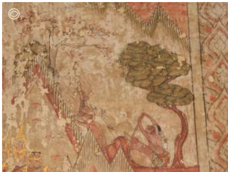
วัดช่องนนทรี กรุงเทพมหานคร

กัณฑ์ที่ 6 อย่างกัณฑ์จุลพน เป็นกัณฑ์ที่ว่าด้วยการเดินทางครั้งแรกของชูชกเพื่อไปหาพระเวสสันดร ซึ่งถ้าคุณคิดว่าชูชกเป็นยอดนักเดินทาง คุณคิดผิดครับ ชูชกไม่ได้รู้ทางขนาดนั้น แต่ชูชกมีตัวช่วยที่มาโดยไม่ทันตั้งใจ นั่นก็คือพรานเจตบุตรนั่นเอง แถมตัวช่วยยังมาพร้อมบรรยากาศไม่เป็นมิตรด้วย เพราะเจอกันปุ๊บ ชูชกโดนหมาของพรานเจตบุตรไล่จนต้องขึ้นไปหลบบนต้นไม้ แถมเกือบจะโดนยิงดับต้นสิ้นชีวิตี เดชะบุญ สกิลนักพูดระดับเทพของชูชกทำงาน หลอกพรานบุญว่าตัวเองเป็นคนของพระเจ้าสี่ยุ้ย จะมาพาพระเวสสันดรกลับเมือง พรานเจตบุตรก็หลงเชื่อ จึงชวนกันไปกินข้าวที่บ้านแถมยังบอกทางไปให้ชูชกอีกต่างหาก ดังนั้น เมื่อจะเขียนจิตรกรรมตอนนี้ ก็ต้องเขียนฉากที่ชูชกโดนหมาไล่ขึ้นต้นไม้แน่นอนครับ