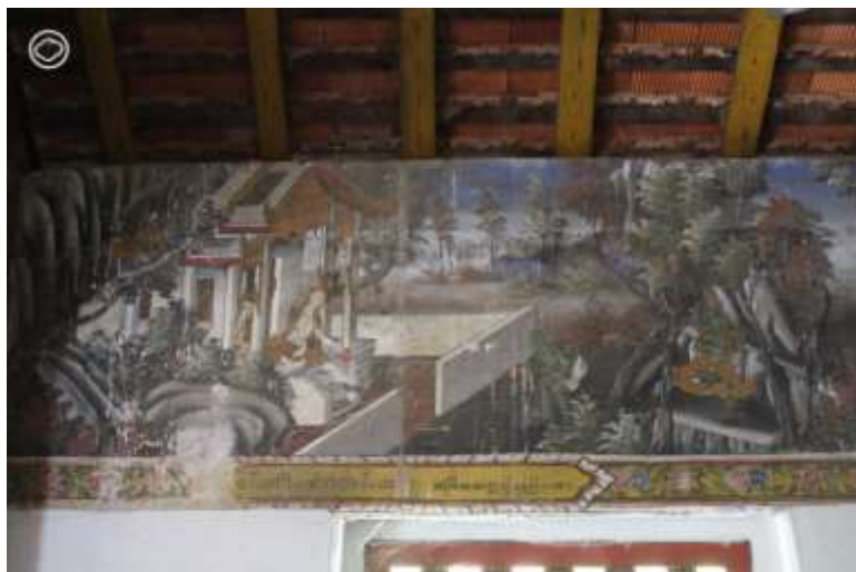
วัดพระแก้วดอนเต้าสุชาดาราม จังหวัด