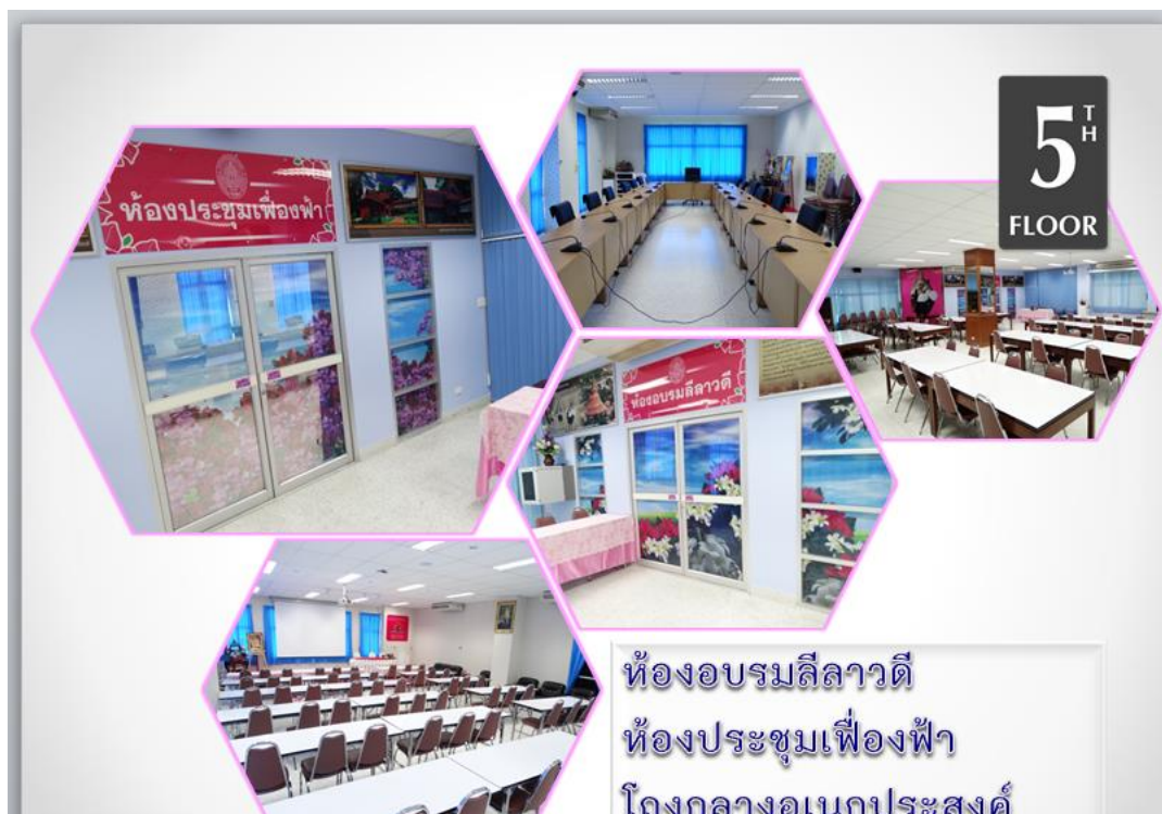
ห้องโถงกลาง ชั้น 5 อาคารห้องสมุด 5 ชั้น