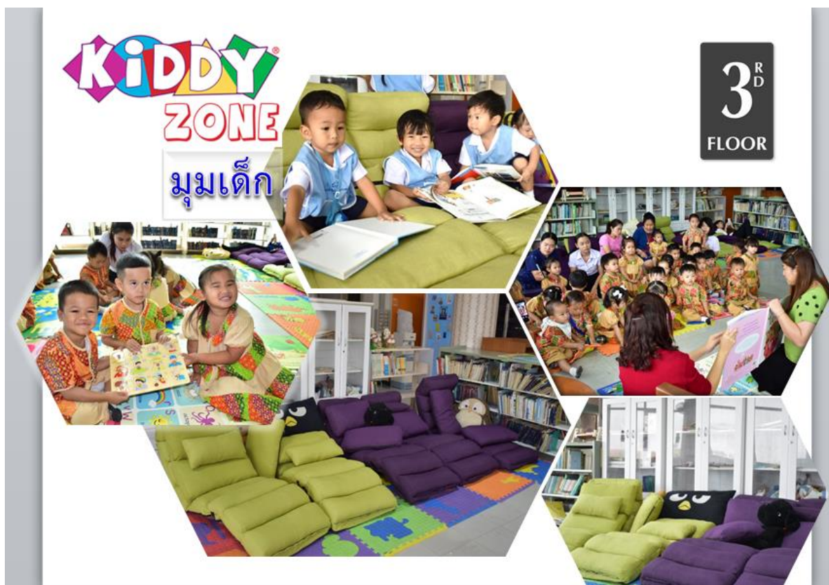
ชั้น 3 อาคารบรรณราชนครินทร์