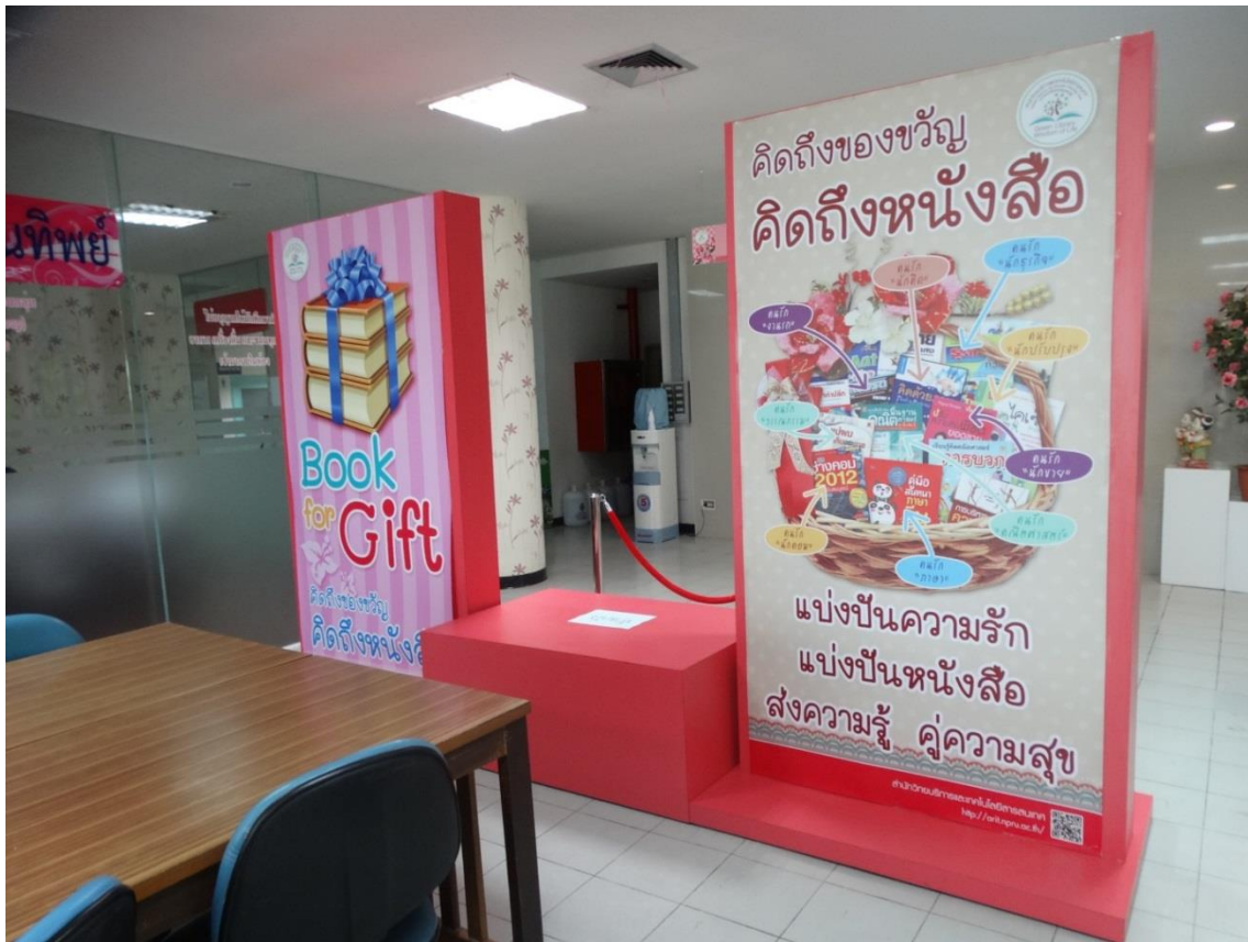
ชั้น 5 อาคารบรรณราชนครินทร์