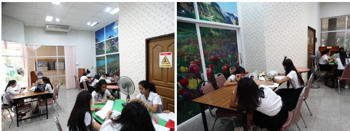
บรรยากาศการเรียนรู้ของห้อง Relax Time สำนักวิทยบริการฯ อาคารห้องสมุด 5 ชั้น