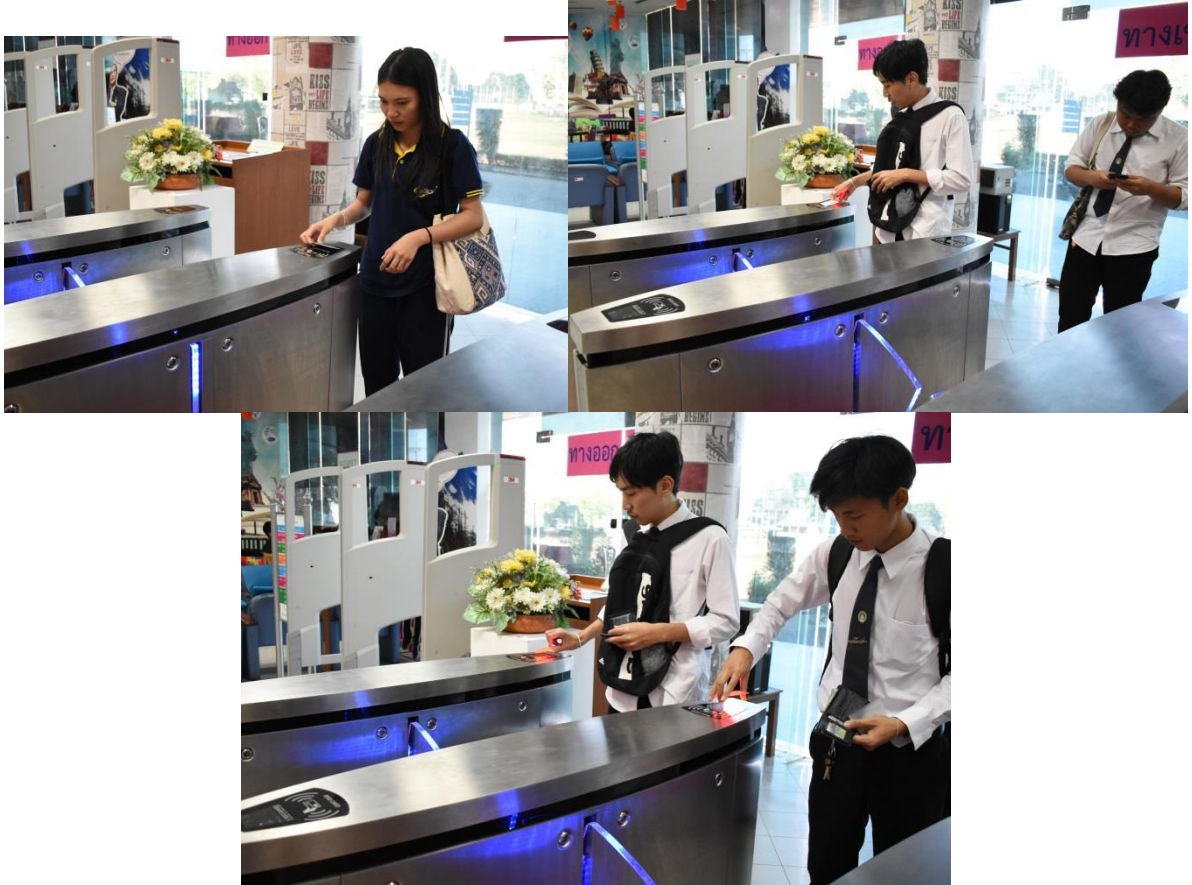
ชั้น 1 อาคารบรรณราชนครินทร์