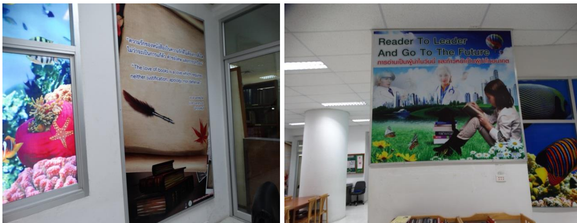
ชั้น 4 อาคารบรรณราชนครินทร์ และชั้น 4 อาคารห้องสมุด 5 ชั้น