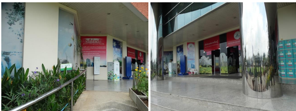
บรรยากาศด้านหน้าสำนักวิทยบริการ อาคารบรรณราชนครินทร์