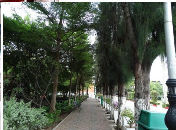
บรรยากาศด้านหลังและบริเวณโดยรอบสำนักวิทยบริการฯ อาคารบรรณราชนครินทร์