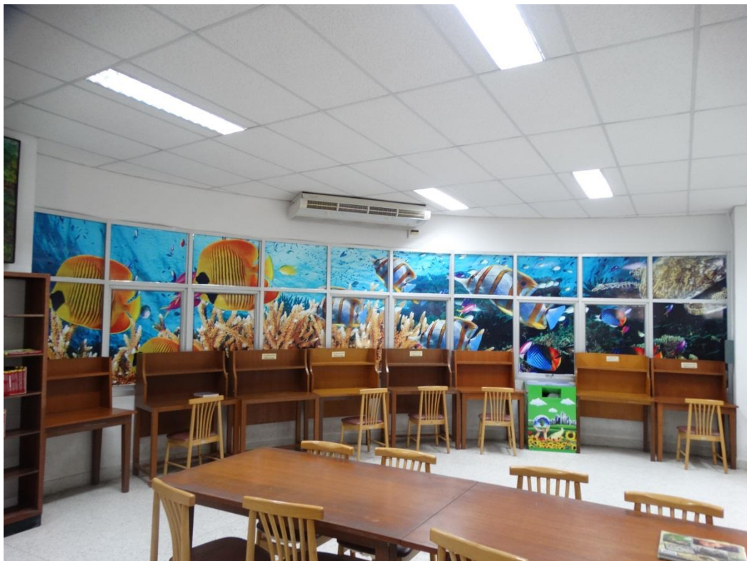
ชั้น 3 อาคารห้องสมุด 5 ชั้น