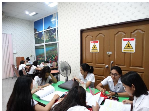
บรรยากาศการเรียนรู้ของห้อง Relax Time สำนักวิทยบริการฯ อาคารห้องสมุด 5 ชั้น