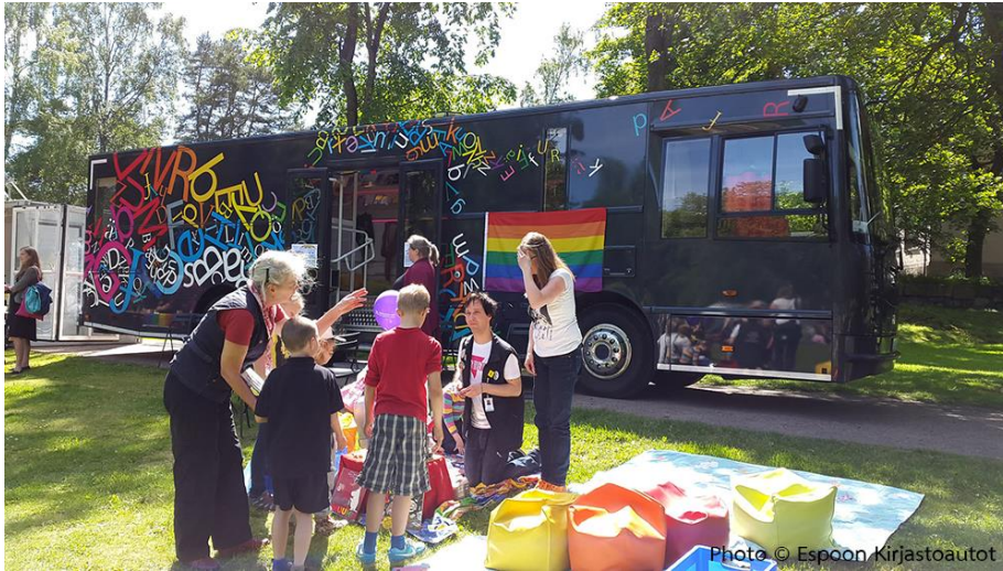
Välkky ห้องสมุดเคลื่อนที่ขวัญใจมหาชน