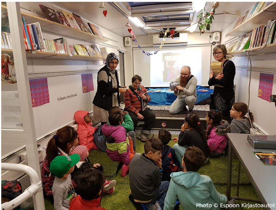
Välkky ห้องสมุดเคลื่อนที่ขวัญใจมหาชน