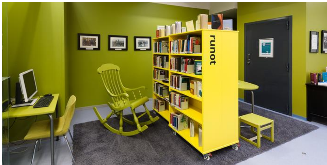
ชั้นหนังสือติดล้อที่ห้องสมุดฮาคุนิลา (Hakunila Library)

ห้องสมุดฮาคุนิลา (Hakunila Library) สาขาหนึ่งของห้องสมุดเมืองวันตา จัดทำแบบสอบถามให้ผู้ใช้บริการแสดงความคิดเห็นเกี่ยวกับการปรับปรุงห้องสมุดและการพัฒนาการให้บริการ พบหลายประเด็นที่น่าสนใจเช่น ผู้ใช้อยากให้ห้องสมุดเป็นศูนย์บริการสารสนเทศ เป็นศูนย์กลางทางด้านวัฒนธรรมท้องถิ่น และเป็นพื้นที่พบปะแลกเปลี่ยนพูดคุยที่เป็นกันเอง ในกลุ่มวัยรุ่นแสดงออกชัดเจนว่าต้องการพื้นที่ที่เป็นส่วนตัวแยกออกจากกลุ่มเด็ก อยากแสดงออกแบบที่มีลักษณะเฉพาะตัว เช่น การขีดเขียนวาดภาพบนผนังหรือกราฟฟิตี (graffiti) การเล่นเกมคอนโซล ส่วนกลุ่มผู้ใหญ่ต้องการที่นั่งแบบผ่อนคลายเป็นพิเศษและมีมุมเฉพาะ นอกจากนี้ยังสะท้อนว่าการจัดหมวดหนังสือด้วยระบบเลขหมู่ตัวอักษรทำให้หาหนังสือยาก