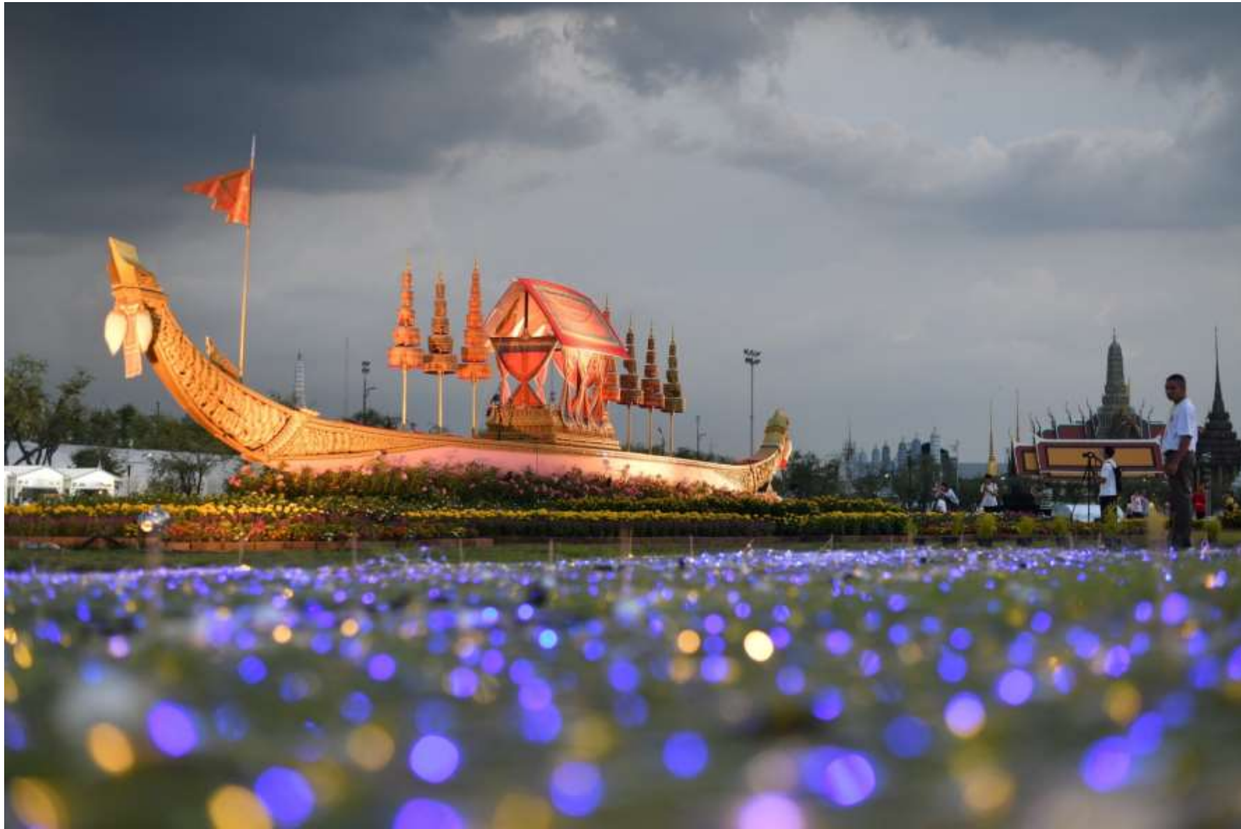
เรือพระที่นั่งอนันตนาคราช