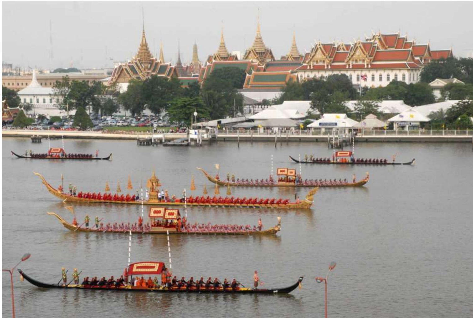
(เรียงจากบนลงล่าง) เรือตั้ง เรือสุครีพครองเมือง เรือพระที่นั่งอนันตนาคราช เรือพาลีรั้งทวีป เรือตั้ง ริ้วสายนอก ประกอบด้วย เรือตั้ง ๒๒ ลำ และเรือแข่ง ๖ ลำ แบ่งเป็นริ้วละ ๑๔ ลำ รวมเป็นจำนวน ๒๘ ลำ