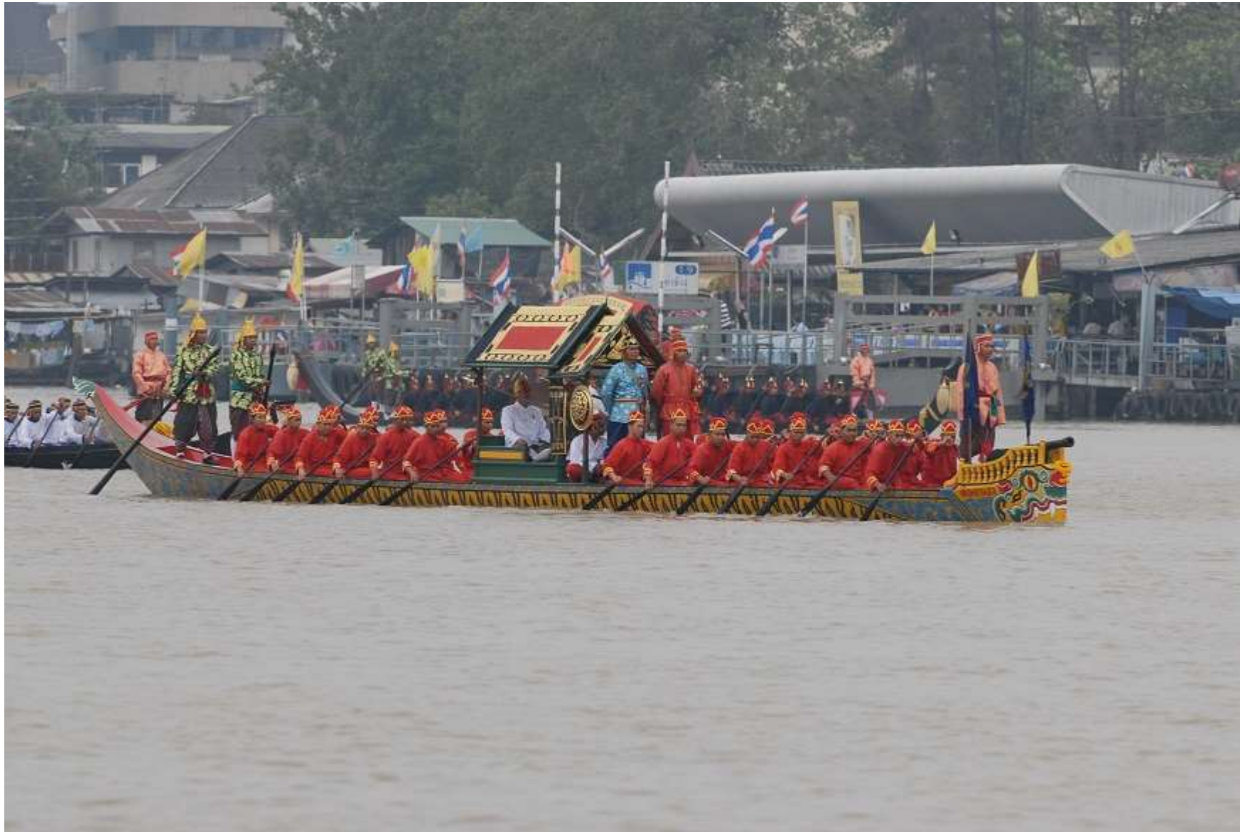
เรือเสือทะเลยานชล