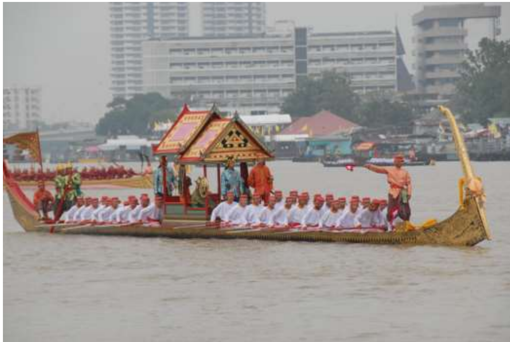
เรือเอกไชยเหินหาว

ใช้กำลังพลประจำเรือลำละ ๔๑ นาย ประกอบด้วย นายเรือ ๑ นาย นายท้าย ๒ นาย ฝีพาย ๓๔ นาย คนถือธงท้าย ๑ นาย พลสัญญาณ ๑ นาย คนกระท่งเสา (ให้จิ้งหะ) ๒ นาย