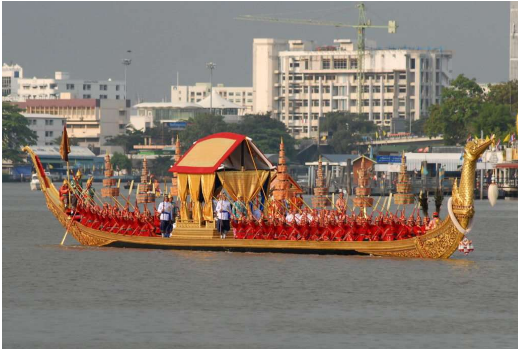
เรือพระที่นั่งสุพรรณหงส์