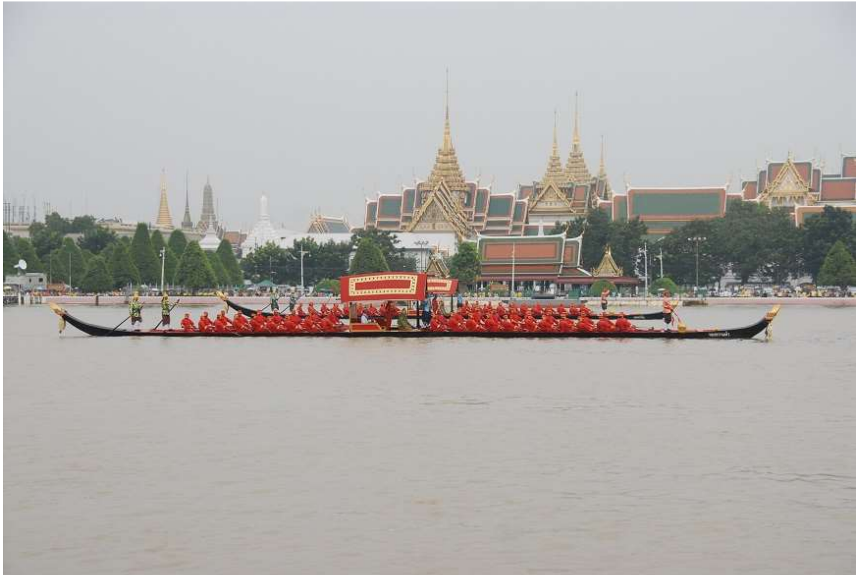
เรือทองขวานฟ้า