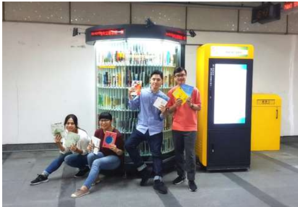
ตู้ยืมหนังสือในสถานีรถไฟใต้ดิน