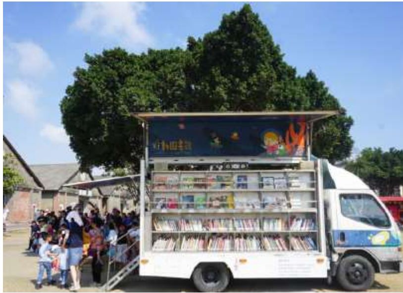
ห้องสมุดเคลื่อนที่

ตู้ยืมหนังสืออัตโนมัติ ตั้งอยู่ในสถานีรถไฟใต้ดิน เป็นระบบที่อำนวยความสะดวกให้คนเมืองที่มีวิถีชีวิตรีบเร่ง สามารถใช้เวลาระหว่างการเดินทางสำหรับอ่านหนังสือ ซึ่งมีให้บริการตลอด 24 ชั่วโมง