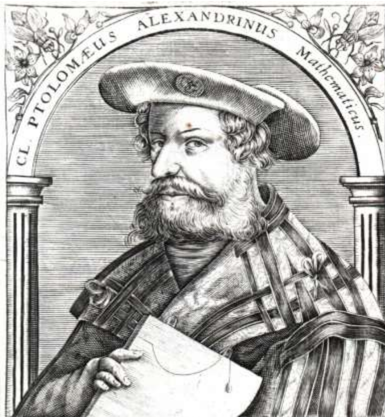
พระเจ้าอเล็กซานเดอร์