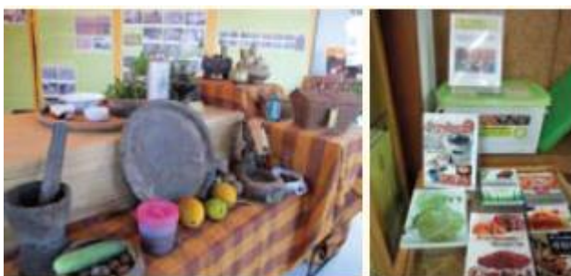
นิทรรศการเรื่องแนวกินอีสานและกล่องความรู้กินได้