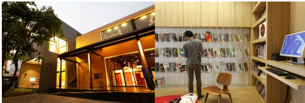
ศูนย์สร้างสรรค์งานออกแบบ (TCDC) เชียงใหม่

ในอนาคตห้องสมุดเฉพาะทางซึ่งทำหน้าที่ตอบสนองความต้องการของผู้ที่สนใจและเชี่ยวชาญเฉพาะด้านจะมีความจำเป็นต่อการพัฒนาประเทศมากขึ้น เพราะถึงแม้ว่าปัจเจกบุคคลจะสามารถแสวงหาความรู้ทั่วไปได้ด้วยตนเอง แต่การเข้าถึงความรู้เฉพาะทางด้วยตนเองยังมีต้นทุนค่อนข้างสูง เช่น หนังสือเกี่ยวกับการออกแบบบางเล่มมีมูลค่าหลายหมื่นบาท ดังนั้น ห้องสมุดในลักษณะนี้จึงเริ่มปรากฏให้เห็นเพิ่มขึ้นอย่างมากในรอบสิบปีที่ผ่านมา อาทิ ศูนย์สร้างสรรค์งานออกแบบ (TCDC) แหล่งค้นคว้าด้านการออกแบบและความคิดสร้างสรรค์เพื่อเพิ่มขีดความสามารถของผู้ประกอบการไทย ปัจจุบัน TCDC เปิดให้บริการแล้วทั้งที่กรุงเทพฯ และเชียงใหม่ ห้องสมุดเพื่อชีวิตและสิ่งแวดล้อมหรือ KU Eco Library ซึ่งเน้นจุดประกายความคิดเรื่องสิ่งแวดล้อมและการอนุรักษ์ธรรมชาติ ด้วยการออกแบบห้องสมุดจากเศษวัสดุเหลือใช้ ห้องสมุดการท่องเที่ยว ของการท่องเที่ยวแห่งประเทศไทย ซึ่งเป็นแหล่งรวมหนังสือด้านอุตสาหกรรมท่องเที่ยวทั้งภาษาไทยและภาษาอังกฤษ เป็นต้น