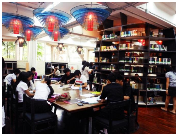
ห้องสมุดเพื่อชีวิตและสิ่งแวดล้อม หรือ KU Eco Library

ในอนาคตห้องสมุดเฉพาะทางซึ่งทำหน้าที่ตอบสนองความต้องการของผู้ที่สนใจและเชี่ยวชาญเฉพาะด้านจะมีความจำเป็นต่อการพัฒนาประเทศมากขึ้น เพราะถึงแม้ว่าปัจเจกบุคคลจะสามารถแสวงหาความรู้ทั่วไปได้ด้วยตนเอง แต่การเข้าถึงความรู้เฉพาะทางด้วยตนเองยังมีต้นทุนค่อนข้างสูง เช่น หนังสือเกี่ยวกับการออกแบบบางเล่มมีมูลค่าหลายหมื่นบาท ดังนั้น ห้องสมุดในลักษณะนี้จึงเริ่มปรากฏให้เห็นเพิ่มขึ้นอย่างมากในรอบสิบปีที่ผ่านมา อาทิ ศูนย์สร้างสรรค์งานออกแบบ (TCDC) แหล่งค้นคว้าด้านการออกแบบและความคิดสร้างสรรค์เพื่อเพิ่มขีดความสามารถของผู้ประกอบการไทย ปัจจุบัน TCDC เปิดให้บริการแล้วทั้งที่กรุงเทพฯ และเชียงใหม่ ห้องสมุดเพื่อชีวิตและสิ่งแวดล้อมหรือ KU Eco Library ซึ่งเน้นจุดประกายความคิดเรื่องสิ่งแวดล้อมและการอนุรักษ์ธรรมชาติ ด้วยการออกแบบห้องสมุดจากเศษวัสดุเหลือใช้ ห้องสมุดการท่องเที่ยว ของการท่องเที่ยวแห่งประเทศไทย ซึ่งเป็นแหล่งรวมหนังสือด้านอุตสาหกรรมท่องเที่ยวทั้งภาษาไทยและภาษาอังกฤษ เป็นต้น