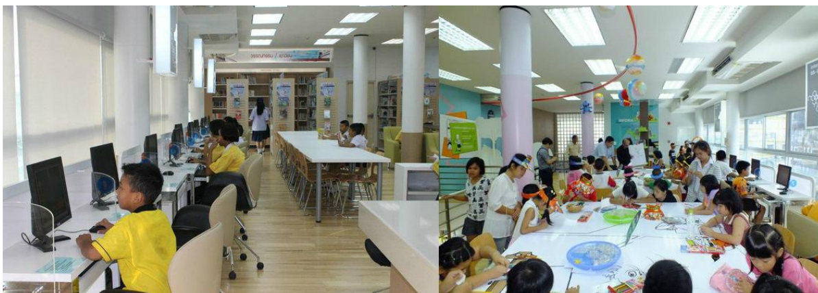
ห้องสมุดเพื่อการเรียนรู้ ห้วยขวาง

การปลูกฝังการอ่านที่ยั่งยืนคือการเริ่มต้นส่งเสริมการอ่านตั้งแต่วัยเยาว์ แต่ห้องสมุดทั่วไปอาจไม่สามารถตอบสนองความอยากอ่านของเด็กได้ เพราะเด็กมีความสนใจเรื่องราวที่แตกต่างไปจากผู้ใหญ่ ปัจจุบันห้องสมุดหลายแห่งจึงได้จัดพื้นที่การอ่านและหนังสือสำหรับเด็กไว้ด้วย นอกจากนี้ ยังมีห้องสมุดสำหรับเด็กโดยเฉพาะ อาทิ ห้องสมุดการ์ตูน ที่ห้องสมุดเพื่อการเรียนรู้ ห้วยขวาง ของกรุงเทพมหานครซึ่งเต็มไปด้วยหนังสือที่น่าพาเด็กไปอยู่ในโลกแห่งจินตนาการ แม้ว่าผู้ใหญ่บางคนจะมองว่าการ์ตูนเป็นหนังสือที่ไร้สาระ แต่จริงๆ แล้วสามารถช่วยสร้างแรงบันดาลใจและปลูกฝังนิสัยรักการอ่านให้กับเด็กๆ ได้ ภายในห้องสมุดมีหนังสือการ์ตูนให้บริการกว่า 7,000 เล่ม มีห้องฉายภาพยนตร์แอนิเมชัน ห้องอ่านนิทาน มุมหนังสือการ์ตูน 3 มิติ และมีพื้นที่จัดกิจกรรม อาทิ การวาดภาพระบายสีการ์ตูน